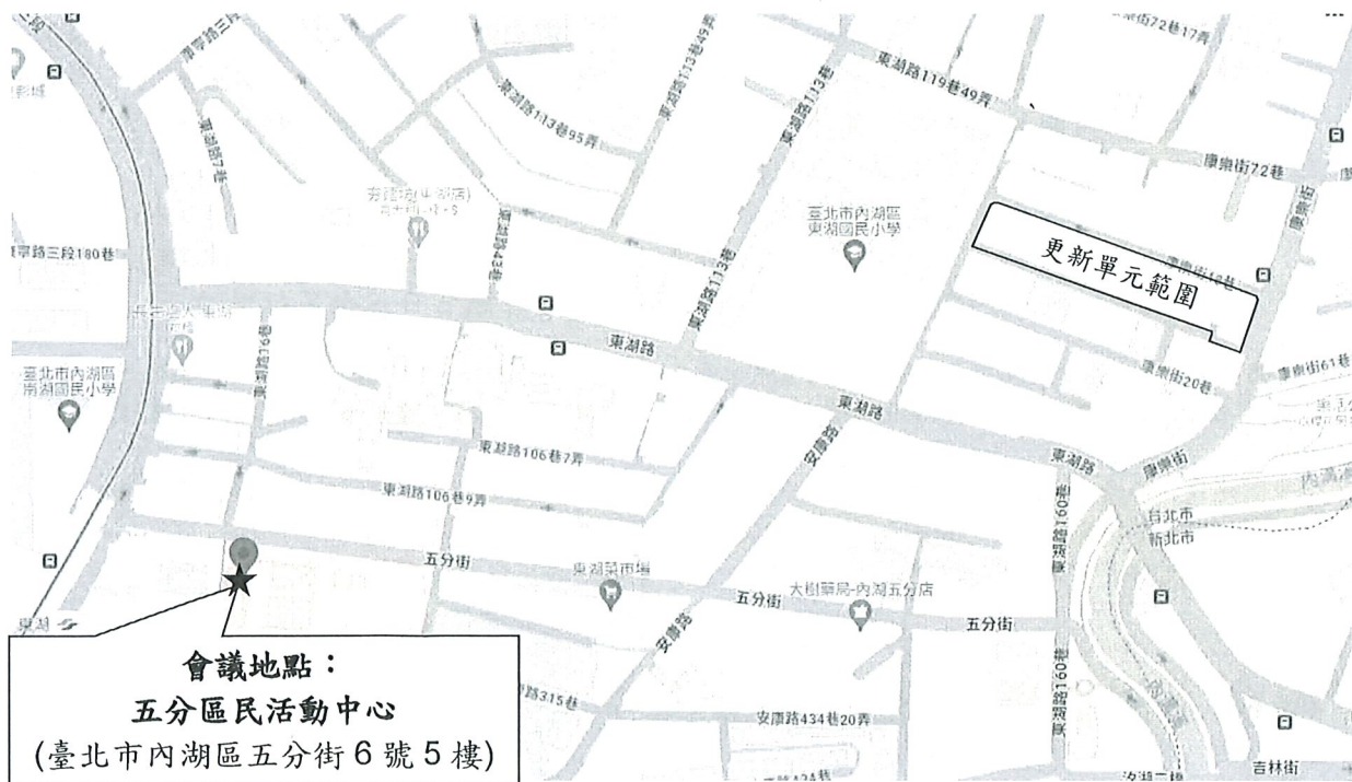
圖 2 開會地點位置示意圖